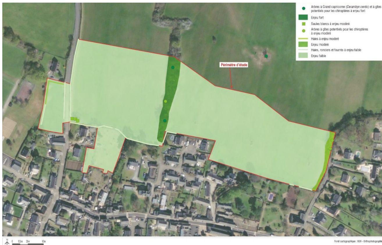
Figure 41 : Synthèse des enjeux faunistiques

Carte issue de l'étude d'impact – version avril 2022 – page 172