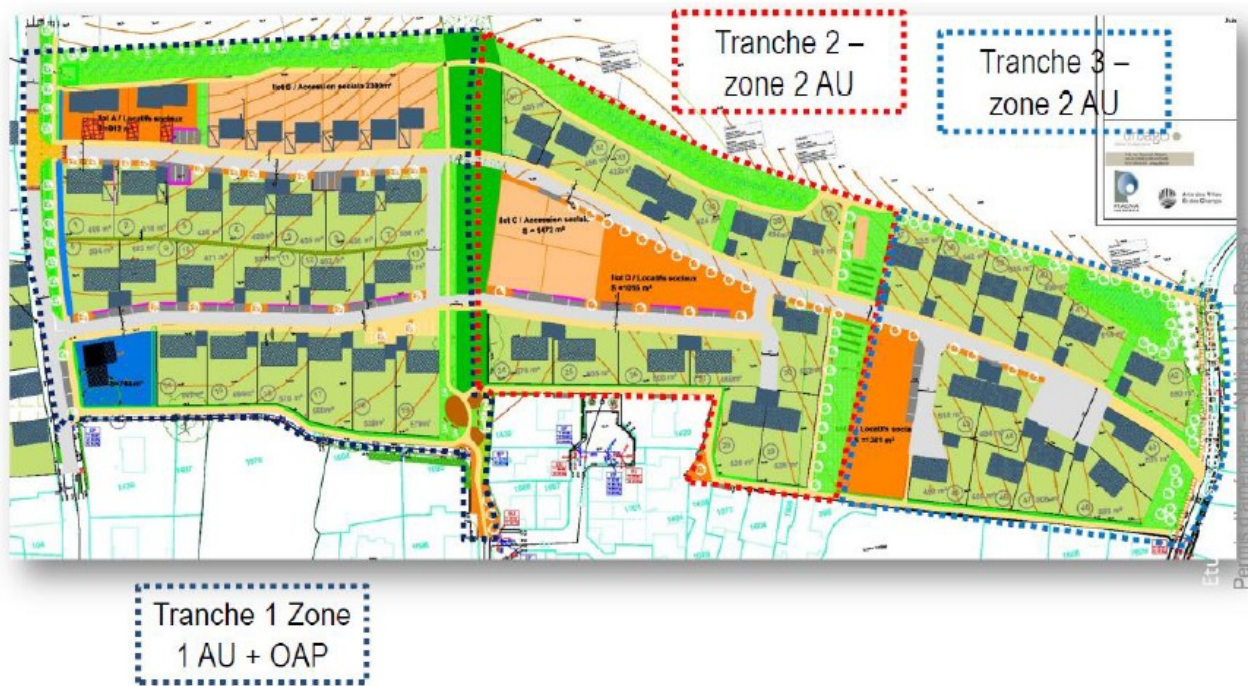
Principes généraux d'aménagement et réflexion d'ensemble sur le secteur – plan issu de l'étude d'impact page 260 dans sa version d'avril 2022.